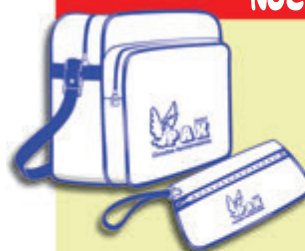
Bolsa y cartera documentación